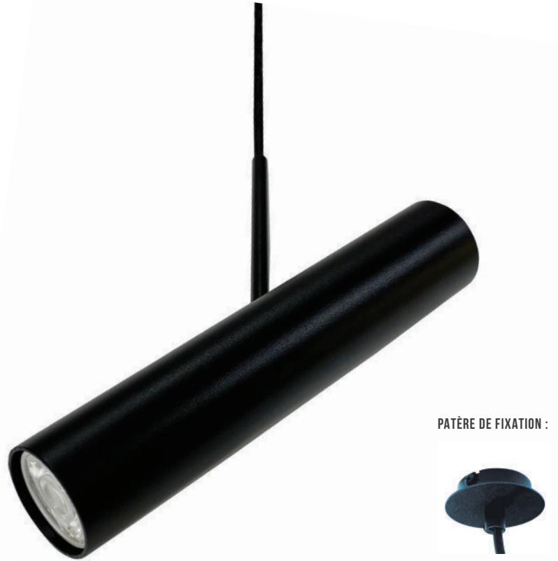
PATÈRE DE FIXATION :